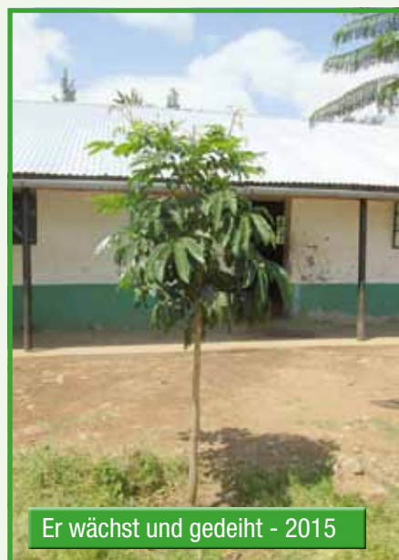
Er wächst und gedeiht - 2015

Joseph hat gepflanzt, einen kleinen Zaun herumgebaut und versorgt die Pflänzchen mit Wasser. Auch wir sind bemüht, dass keiner den „Garten“ kaputtmacht, = „Grünes Pundo“!