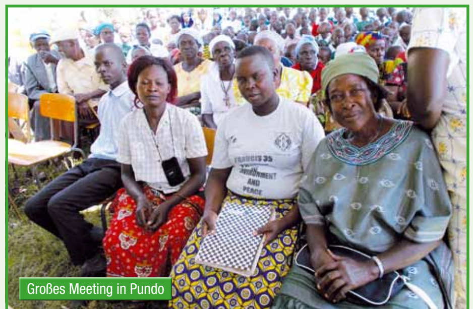
Großes Meeting in Pundo