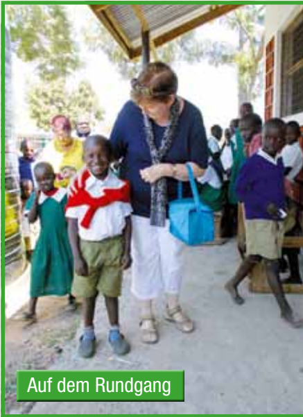
Auf dem Rundgang

zwischendurch zu ihr gehen, wenn man Wunden oder Schmerzen hat. Auch hatsie immer ein Gummibärchen für uns.