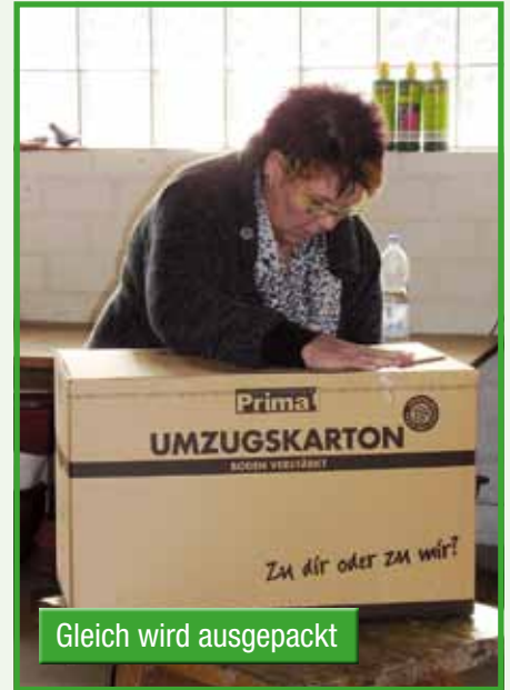
Gleich wird ausgepackt

dieses anvertraut wird. Die weiteren Nachkommen gehören der ersten Familie.