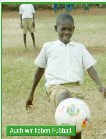
Auch wir lieben Fußball