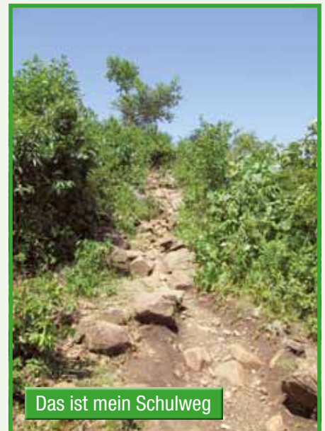
Das ist mein Schulweg

Die Häuser in Pundo liegen – verstreut – bis zu 1.700 m hoch. An klaren Tagen kann man in der Ferne den Viktoriasee sehen. Straßen haben wir keine, nur Pfade. Uns erreicht man am besten zu Fuß. Laster und PKW