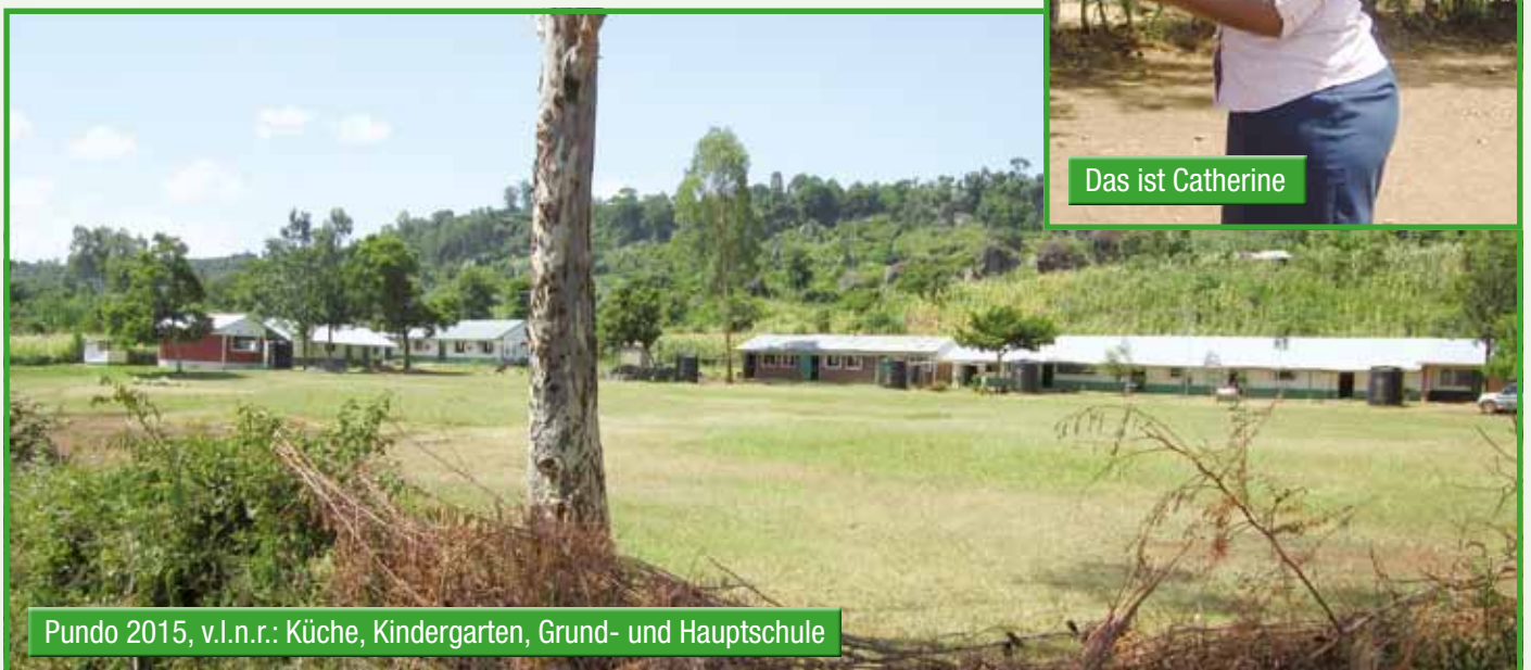
Pundo 2015, v.l.n.r.: Küche, Kindergarten, Grund- und Hauptschule