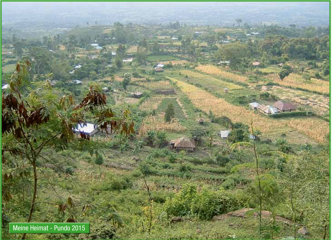
Meine Heimat - Pundo 2015

Hallo und Karibu, liebe Freunde in Deutschland!