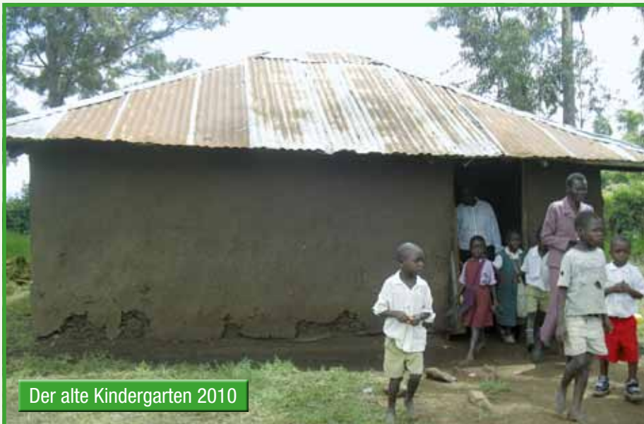
Der alte Kindergarten 2010