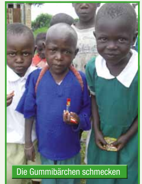
Die Gummibärchen schmecken

eingeschult werden kann. In Kenia müssen alle Kinder ständig Prüfungen ablegen. So muss ich z.B. den Zahlenraum bis 10 (plus und minus) beherrschen, alle Buchstaben kennen und leichte Wörter erlesen können. Erst dann kann ich Schüler der ersten Klasse der 8-klassigen Grund- und Hauptschule werden. Darauf freue ich mich schon sehr, denn inzwischen sieht nicht nur der Kindergarten wunderschön aus, sondern auch die Schule wurde renoviert und hat nun für jedes Kind einen Sitzplatz.