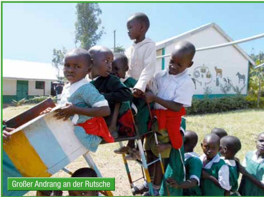
Großer Andrang an der Rutsche