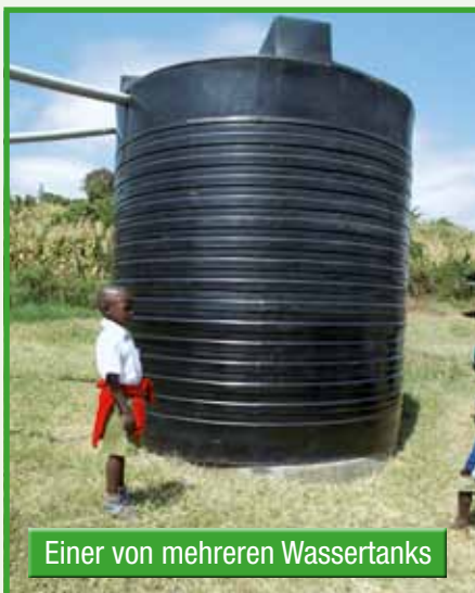
Einer von mehreren Wassertanks